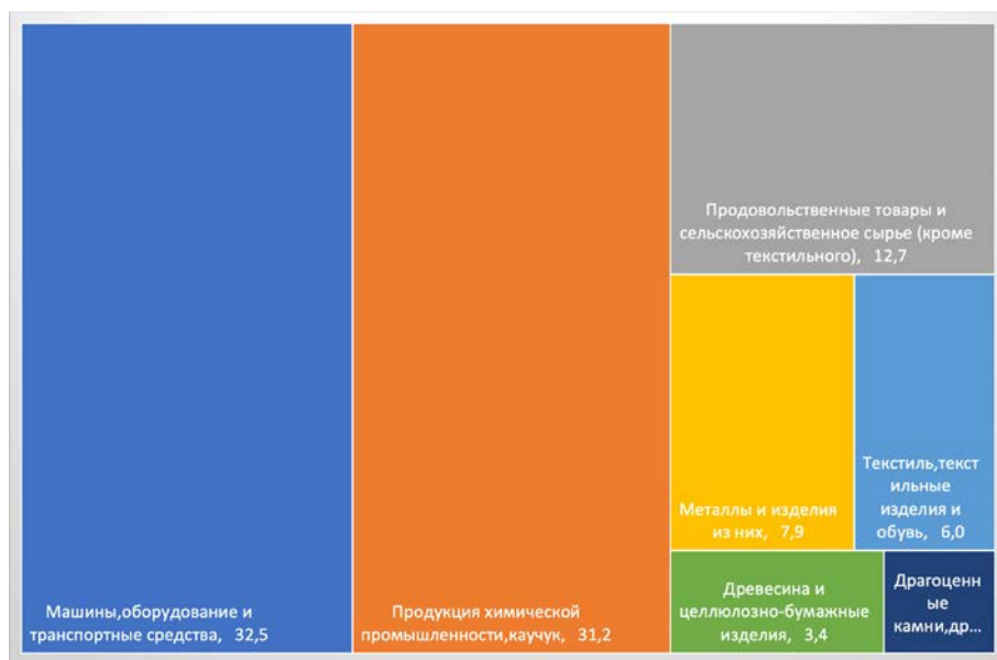
Структура польского экспорта в Россию в 2022 г., в%.